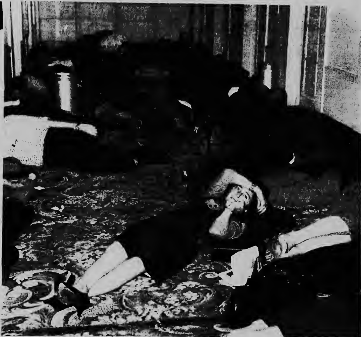
NEW YORK--Mientras cu ta birando anochi y no tin corriente, un di e gangnan di Sheraton Atlantic Hotel ta yen di hende drumi riba suela. E personanan aki a caba di sali for di nan trabao ora cu corriente a bai di repente.

Pero por lo menos lo e no ta un camño asina drástico, manera e por tabata si nan a bini directamente for di New York, el a bisa.